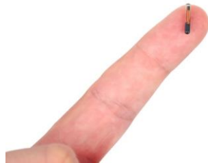
Transponder (RFID-Mikrochip in der Grösse eines Reiskorns)