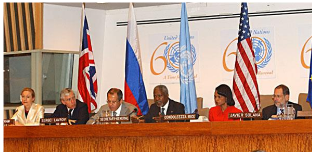
Photo von 20.09.2005 mit 666 an der Wand!; v.l.n.r.: Benita Ferrero-Waldner - EU-Kommissarin, Jack Straw - Grossbritannien, Sergie Lavrov- Russland, Kofi Annan - U.N., Condoleezza Rice - USA, Javier Solana - E.U.

Bei einer Sitzung 2005 im UNO-Hauptquartier in New York City stand dreimal die Zahl 6 an der Wand geschrieben = 666 . Weitere interessante Ausführungen über die UNO finden Sie auch beim Schweizer Friedensforscher Dr. Daniele Ganser.