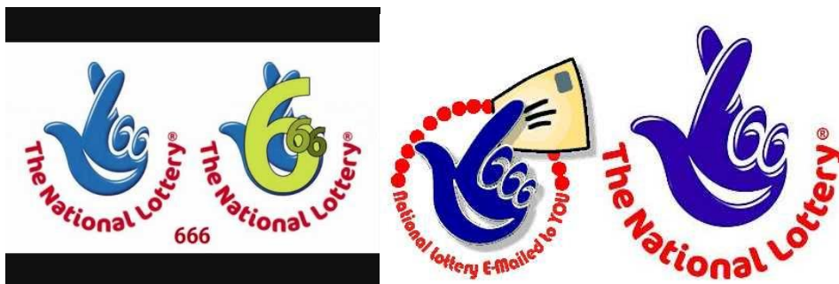
Altes Logo der Lottoagentur im Vereinigten Königreich mit der Zahl 666.

Die Chance beim Lotto zu gewinnen, beträgt Eins zu 140 Millionen (1:140`000`000), trotzdem spielen viele Leute Lotto, weil sie hoffen, dass sie der alleinige Eine der 140 Millionen sind. Mit einem vernünftigen und gerechten Geldsystem würden alle Menschen gleichermaßen profitieren und Glücksspiele gehören der Vergangenheit an.